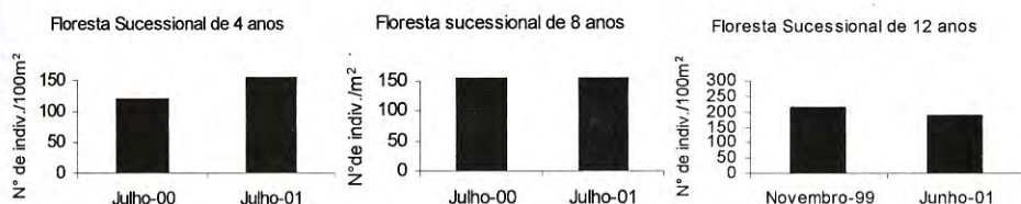
Figura 2 - Densidade (indivíduos/100m 2 ) em um período de 12 meses (nas florestas de 4 e 8 anos) e 18 meses (na floresta de 12 anos), na Estação Experimental da Universidade Federal Rural da Amazônia, Castanhal, Pará.